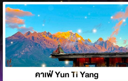
กาแฟ Yun Ti Yang