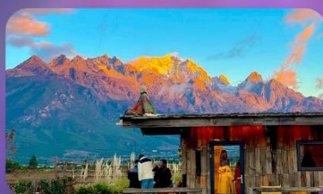
คาเฟ่ Yun Ti Yang