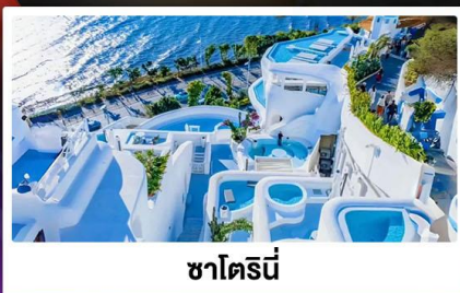
ซาไดร์นี่